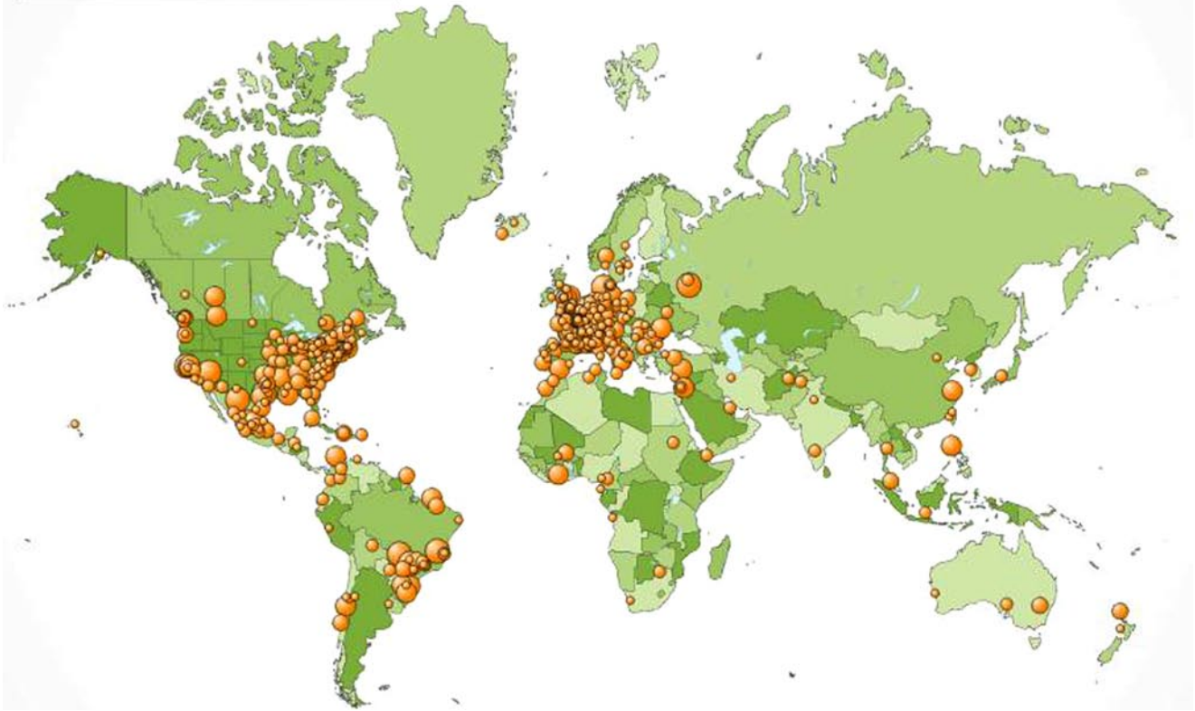
Abb. 3 ▲ Nutzerstatistik – weltweit

abgefragt werden, die z. B. mit Patientenrekrutierung einhergehen. Die Datenbank bietet sich generell als Ausgangsbasis für weiterführende Recherchen an: Veröffentlichung mit Bezugnahme auf die gesuchte Krankheit sind bequem über eine direkte Verlinkung zu PubMed abrufbar, ebenso relevante OMIM-Einträge, aber auch vorhandene Gendatenbanken und Register. Als relationale Datenbank verweist Orphanet so auf alle wichtigen Ressourcen, die für die Diagnostik, Betreuung und Versorgung von Patienten mit seltenen Krankheiten von Bedeutung sind und kann sicherlich nicht zuletzt dazu beitragen, in der humangenetischen Beratung und Befundung viel Zeit zu sparen.