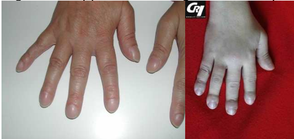
Figure 4 : hippocratisme digital chez un patient MWS

Archives du Pr I. Koné-Paut et base d'images du CRI-Dr AM Prieur