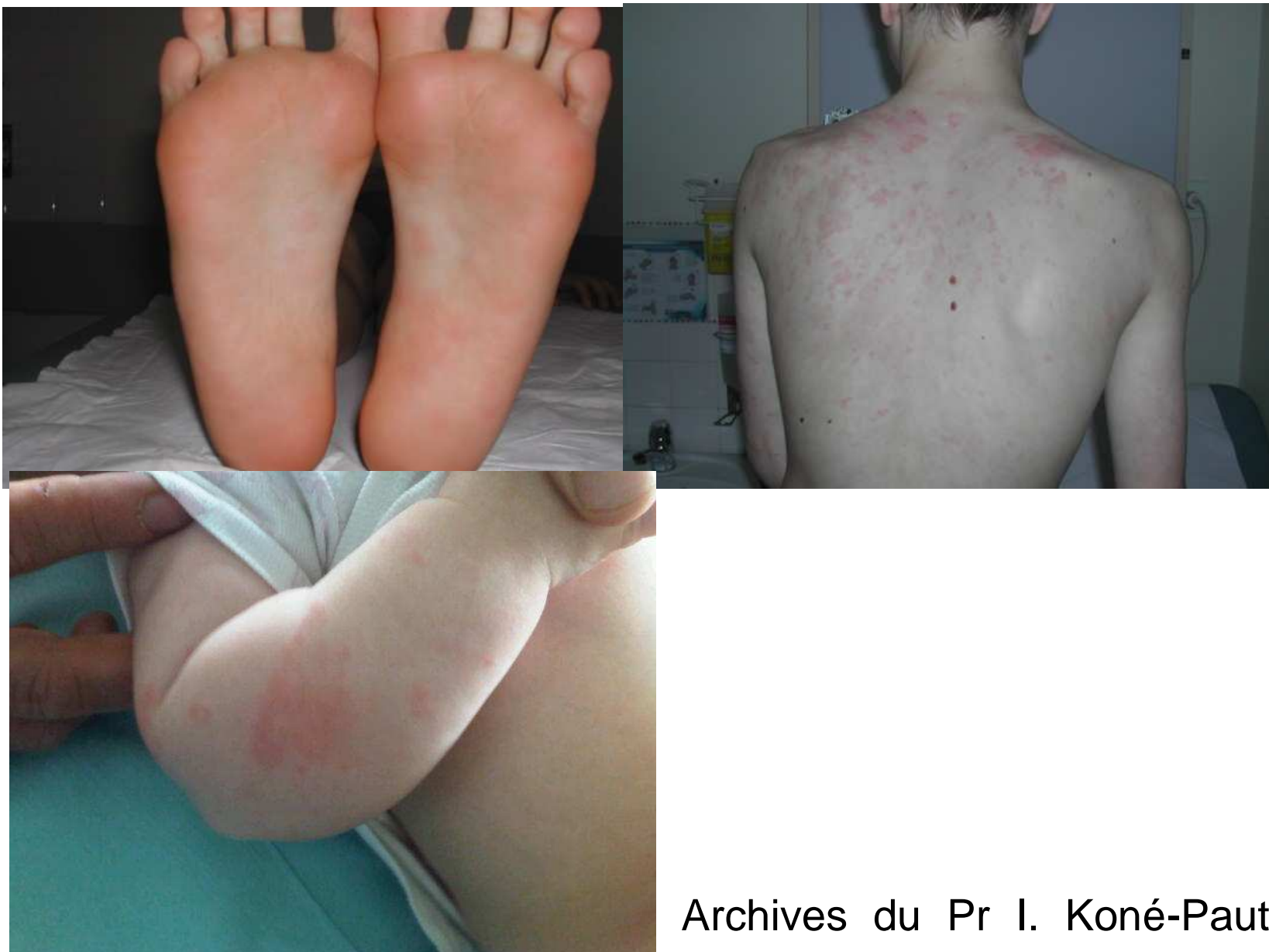
Figure 1 : éruption d'allure urticarienne chez des patients MWS

• d'éruption d'allure urticarienne, notamment par sa chronologie fugace, non prurigineuse, ressentie comme «cuisante» et douloureuse, parfois déclenchée par le froid ou le stress, symptomatique dès la première année de vie dans la majorité des cas, et avant 20 ans plus généralement (Figure 1). Le rash est souvent plus apparent le soir. Il dure en moyenne 1 à 3 jours; histologiquement, il s'agit le plus souvent d'une dermatose urticarienne neutrophilique. Le rash s'accompagne souvent d'œdèmes distaux des membres. Certains patients présentent une aphtose buccale récurrente, des folliculites, un érythème noueux ou une ichtyose ; d'autres signes cutanés peuvent apparaître dans l'évolution : érythème en bande de la face dorsale des mains, et érythème périunguéal.