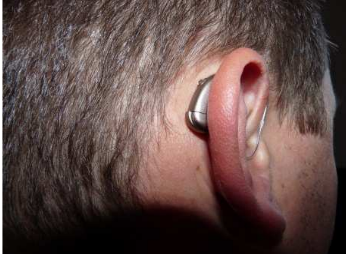
Figure 2 : appareillage auditif chez un jeune patient MWS