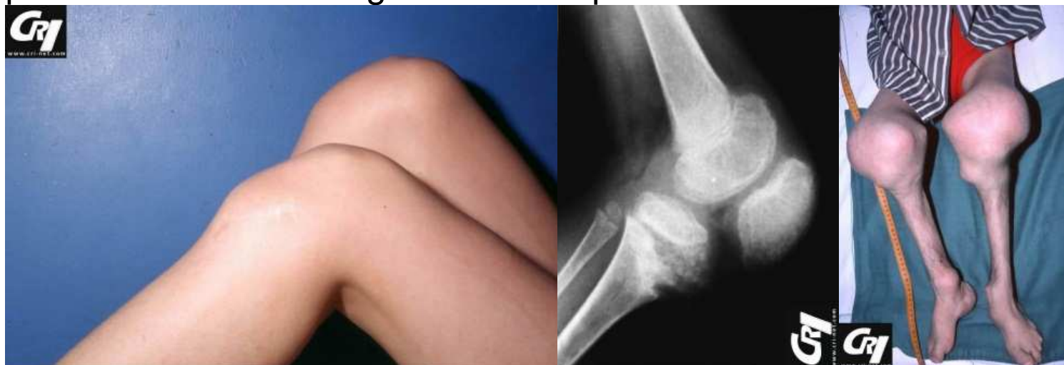
Figure 3 : hypertrophie apophysaire/épiphysaire exubérante au genou par atteinte des cartilages chez des patients CINCA