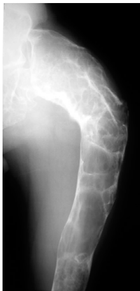
Figure 2 Radiographie montrant des lésions très sévères au niveau du fémur, avec une déformation très importante de l'os (qui est courbé). (Imagerie musculosquelettique - Pathologie générales de Anne Cotten. Page 523 Masson, 2005. Avec l'aimable autorisation des éditions Masson)