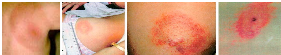
Figure 2 Exemple d'érythèmes migrants ( http://www.tiquatac.org )

Elle apparaît environ 2 à 32 jours après la piqûre de tique et la principale manifestation est une lésion au niveau de la peau appelée érythème chronique migrant (ou érythème migrant) ( Figure 3 ) qui se situe au niveau de la piqûre de tique. Il s'agit d'un « halo » rouge qui s'étend lentement de façon centrifuge (du centre vers la périphérie) alors que le centre s'éclaircit. Son diamètre peut varier de 3 à à plusieurs dizaines de centimètres (en moyenne 15 cm).