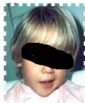
Figure 5 Paralysie faciale ( http://www.labodia.com/fr/lyme/review_fr/clinical_aspects_en.htm#lymphadenosis )