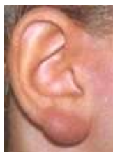
Figure 4 Lymphocytome cutané bénin

Un lymphocytome cutané bénin peut également survenir à ce stade. Il s'agit d'une petite lésion saillante de la peau (nodule) de 1 à 2 cm de diamètre et rouge-violacé siégeant principalement sur le lobe de l'oreille ( Figure 4 ), le mamelon, le scrotum.