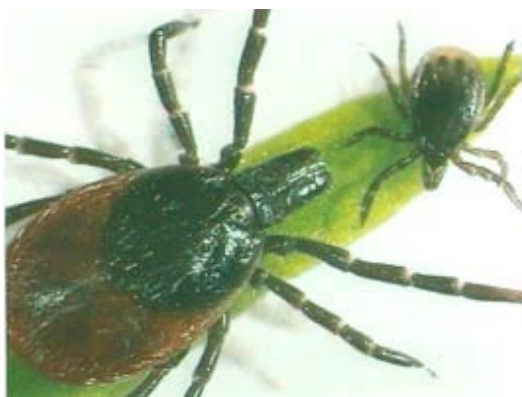
Figure 2 Tique femelle et jeune tique (nymphe)

Il faut savoir qu'une personne infectée suite à une piqûre de tique, ne développe pas forcément la maladie. Par ailleurs, plus la durée de fixation de la tique est longue (en particulier au delà de 24 heures) plus le risque de transmission est grand.